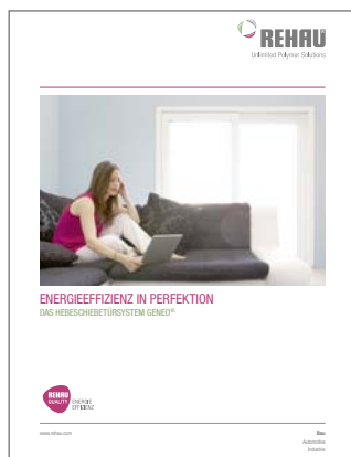
Prospekt GENEOR Hebeschiebetür Drucknummer 985700