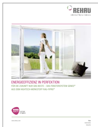
Prospekt GENEOR Fenstersystem Drucknummer 980701

Diese Synergien und die enge Partnerschaft mit den Fensterfachbetrieben und ihren zahlreichen an der REHAU AKADEMIE geschulten Mitarbeitern haben REHAU zum führenden Hersteller von Profilsystemen für Fenster, Fassaden, Türen und Rollladensysteme gemacht.